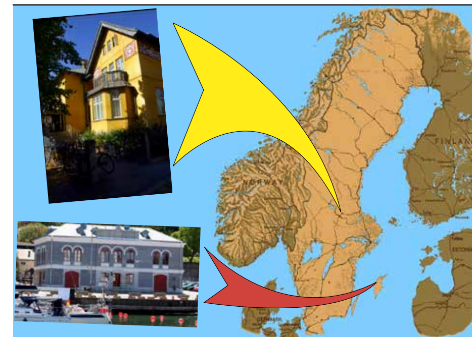
Musikkonservatoriet Falun och Gotlands Tonsättarskola – ett värdefullt samarbete.

Kärnan i Gotlands Tonsättarskolas pedagogiska idé är att de studerande redan från utbildningens start komponerar musik direkt för musiker. På detta sätt utvecklar varje studerande ett personligt förhållningssätt till sin musik och till komponerande samtidigt som de befäster och fördjupar kunskaper i teoretiska ämnen så som notation, instrumentation och form med mera. Vår pedagogiska erfarenhet har visat att de studerande utvecklas mycket snabbt genom det egna komponerandet. De teoretiska kunskaperna omsätts så att säga